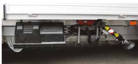
Smart plassering av hydraulikkaggregat, lett tilgjengelig for service.