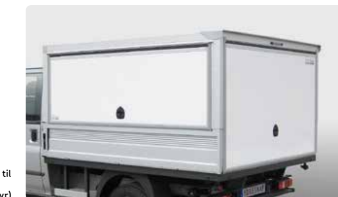
Bakluke ned til plangulv (tilleggsutstyr).