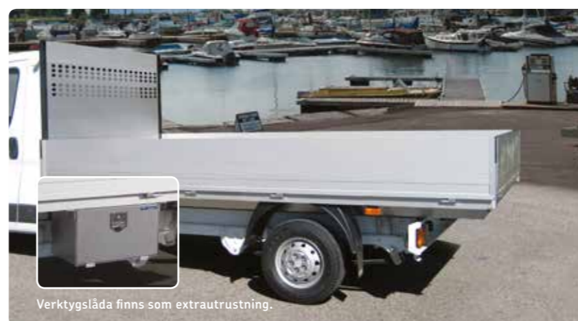
Verktøyglåda finnes som ekstrautrustning.