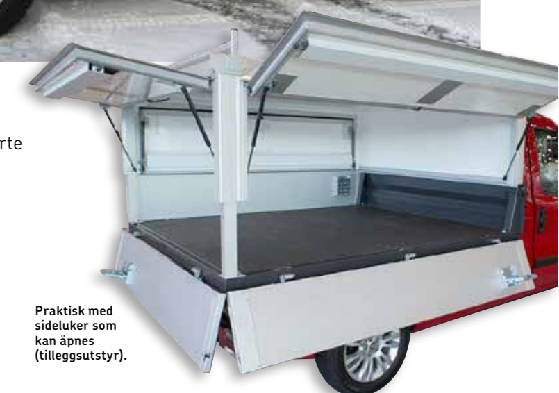
Praktisk med sideluker som kan åpnes (tilleggsutstyr).