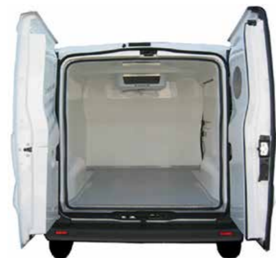
Utstyrt med doble tetninger i side- og bakdører.