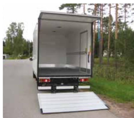
Fri innlastingshøyde med åpen liftluke.

*Ca. påbyggevekt inkl. takspoiler. 4100 x 2100 x 2100 = 750 kg.