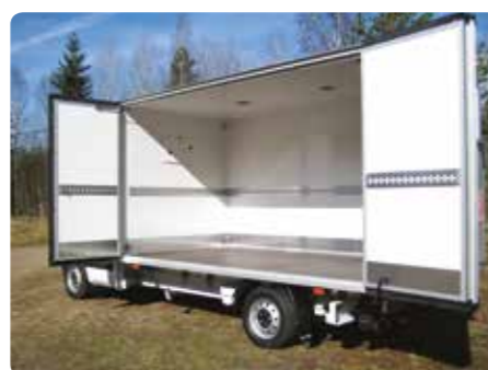
Praktisk sideåpning finnes som tilleggsutstyr.